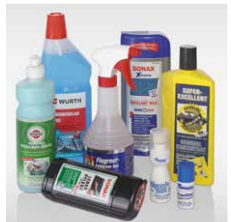
Auch außerhalb der Geschäftszeiten überzeugt vielfältiges Angebot die Kunden