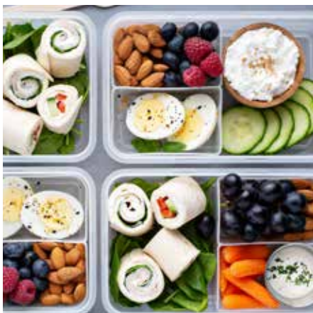
Bieten Sie z. B. saisonales Obst und Gemüse, fertige Gerichte und mehr im SiLine® Outdoor an

*Standortbedingte Abweichungen möglich, direkte Sonneneinstrahlung vermeiden