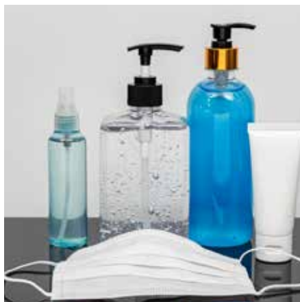
Verkaufen Sie Produkte im Food- und Non-Food-Bereich, Hygieneartikel usw.