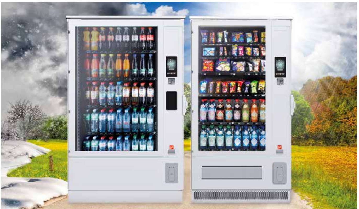
SiLine® GF L RO in Standardfarbe RAL 9010

SiLine® Outdoor – bei jedem Wetter einsatzbereit, nur ein Stromanschluss ist notwendig